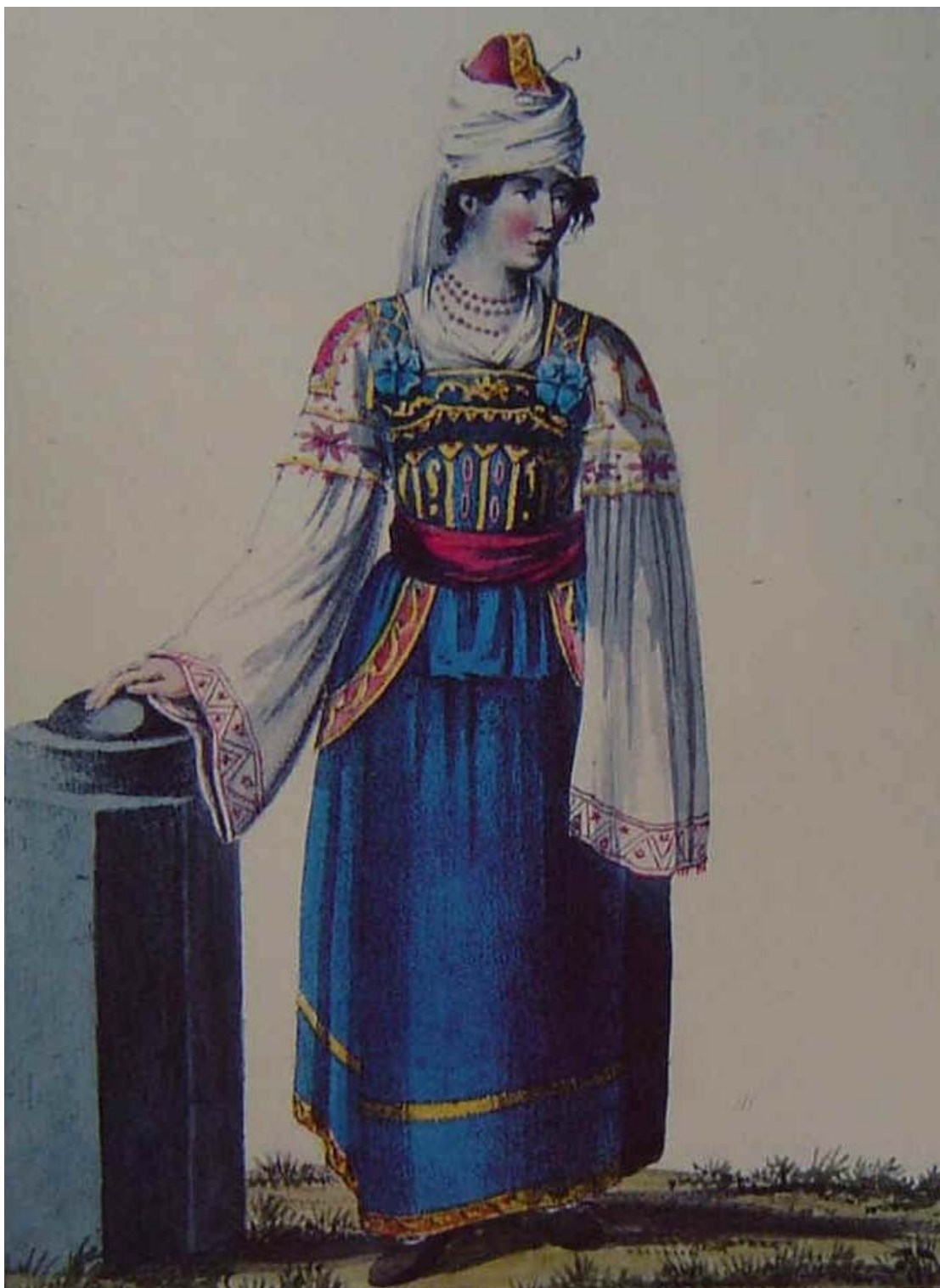
Costume di Vena - Vista di fronte.