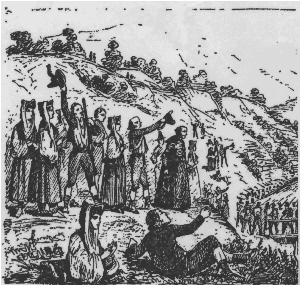
Costumi di Vena – Disegno Francese dell'800. Si notano i soldati francesi in marcia