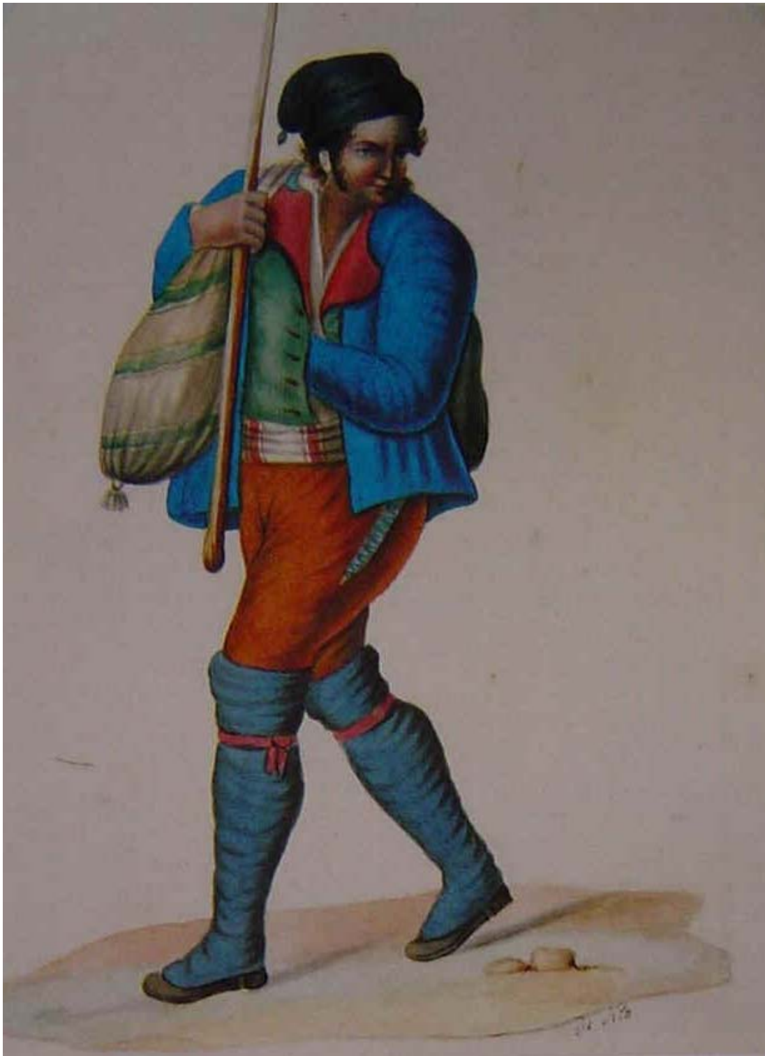
Costume maschile di Vena risalente all'800. Esso però ha le stesse caratteristiche dei costumi calabresi dell'epoca.