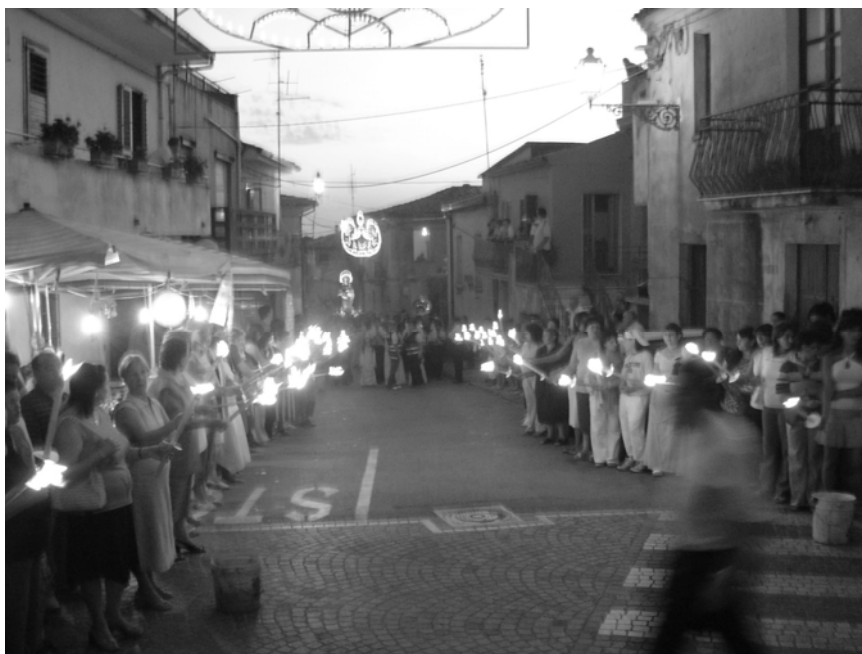
Vena – Processione della Madonna di Bellacava