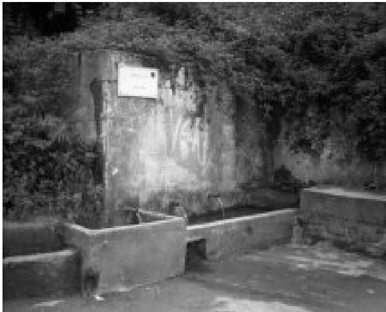
Vena - Fontana grande ( Kroi i madh)