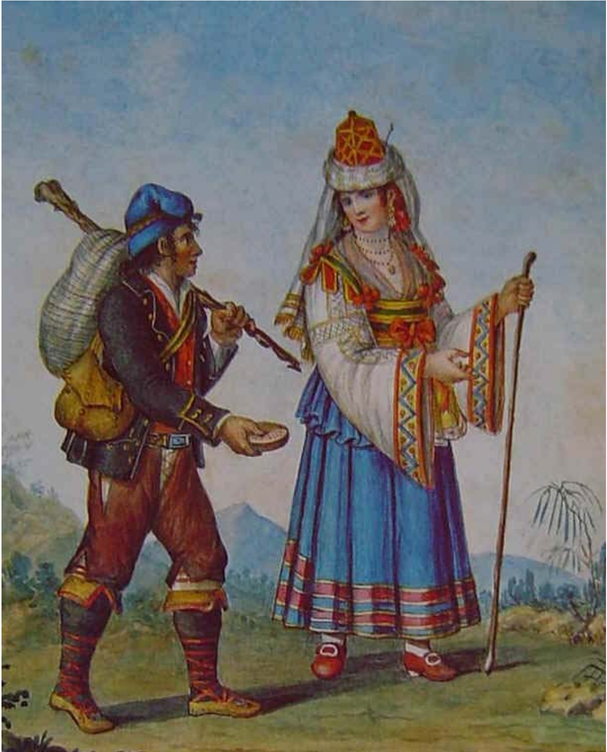
Acquerello non firmato e non datato, attribuibile comunque al Della Gatta