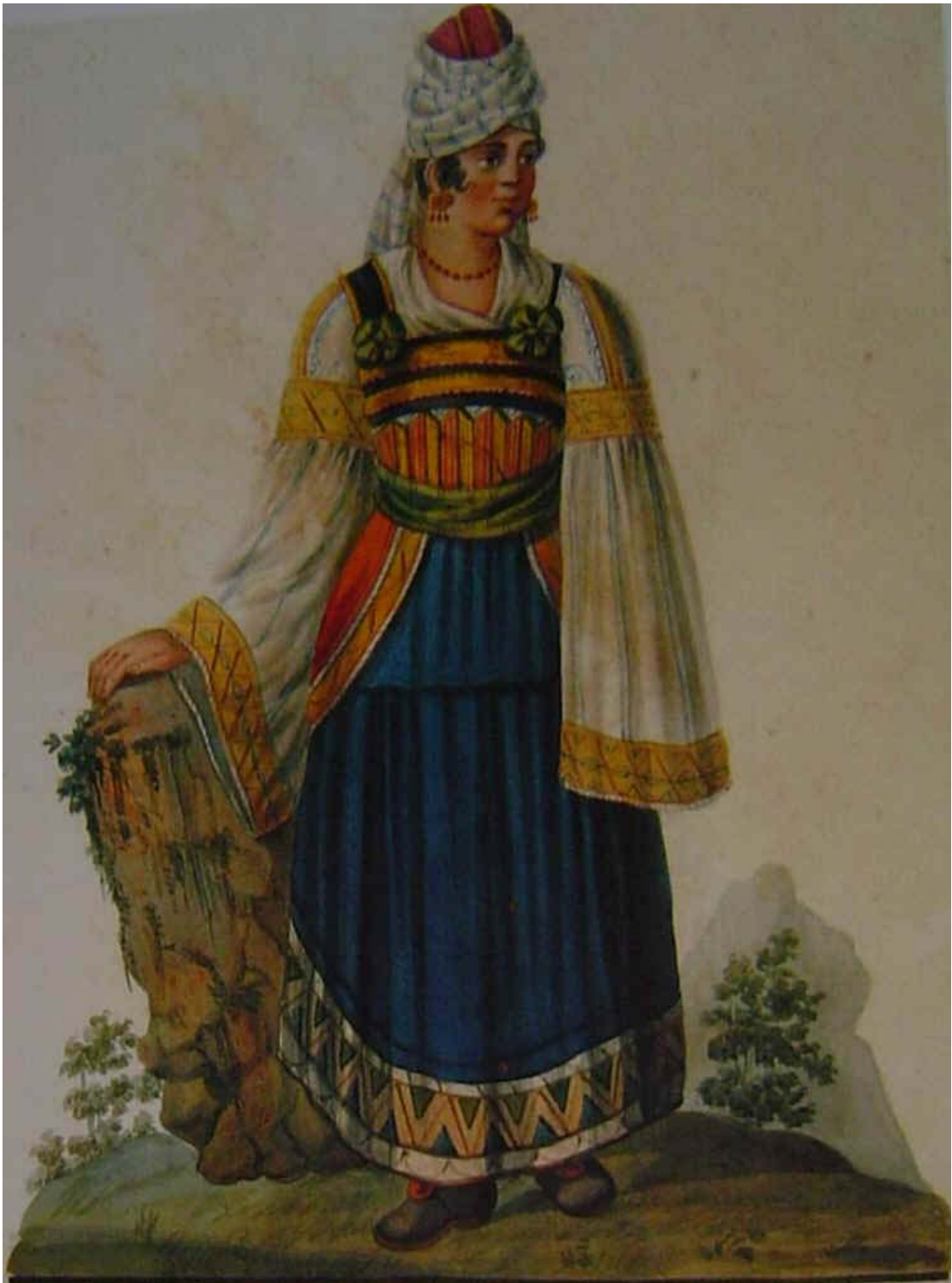
Costume di Vena - acquerello non firmato attribuibile alla DE VITO.