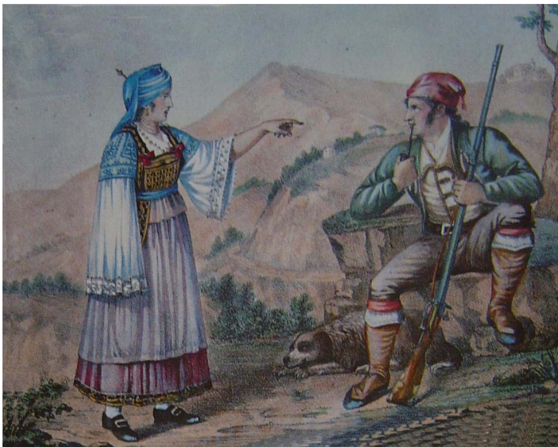
Donna di Vena- Uomo di Caraffa Litografia di Giovanni Forino risalente al 1800 – Collezione Zerbi