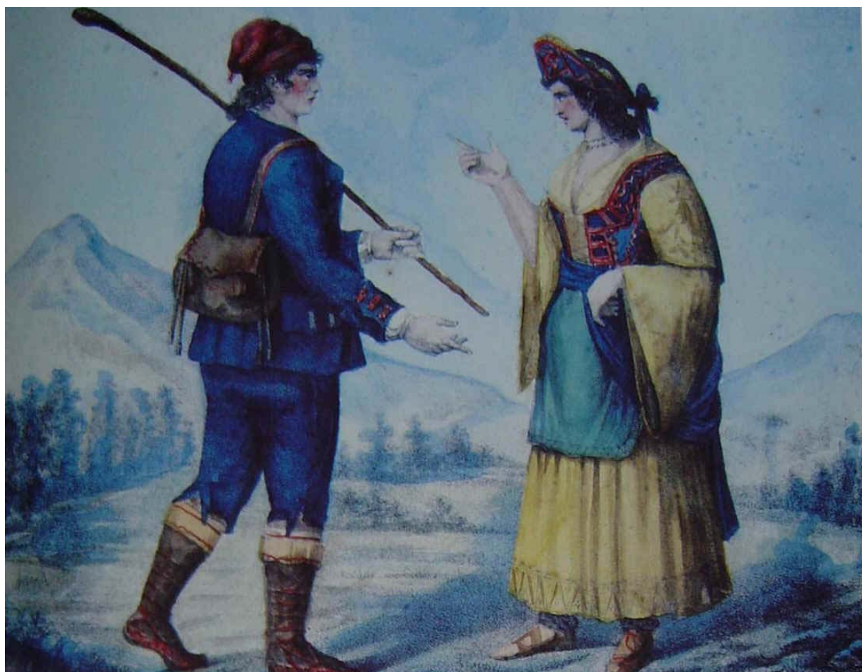
Uomo di Vena - donna di Caraffa. Litografia anonima datata 1825.