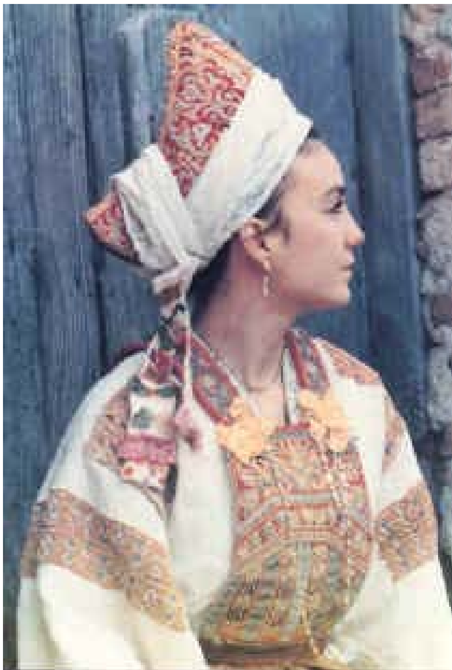
Costume di Vena. Tratto dal libro “Albanesi di Italia”