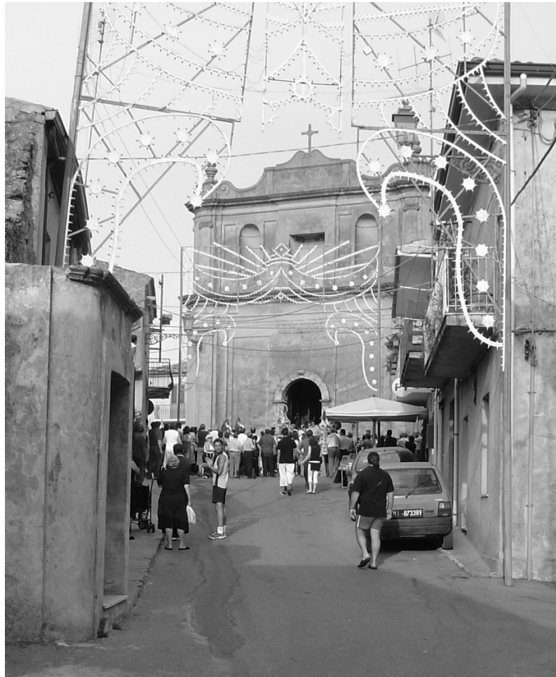
Chiesa di S. Andrea

Vengono riportati, di seguito, copie di documenti rinvenuti presso l'Archivio di Stato di Catanzaro, nelle liste di carico della Cassa Sacra vol. 20 , ossia alla contabilità dei terreni di proprietà delle varie chiese di Vena, dati in affitto. Sono relativi a quattro cappelle: Cappella di Bellacava, Cappella del SS. Sacramento, Cappella del Rosario e Cappella del Purgatorio . Nonché un documento relativo alla contabilità amministrativa da Maggio a Dicembre 1808 dalla raccolta Intendenza di Calabria Ultra busta 193 vol. 1428 – contabilità comunale.