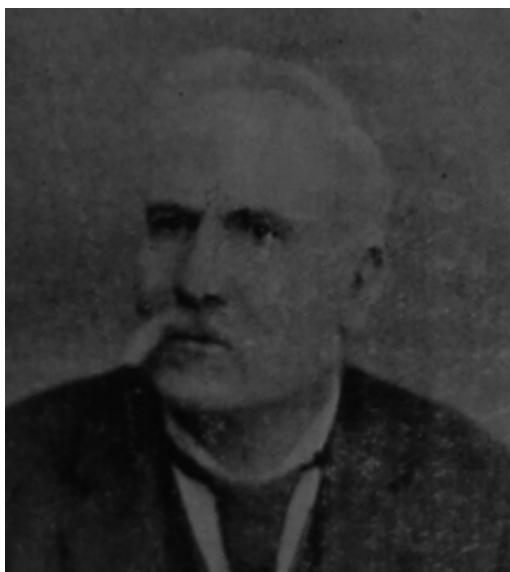
Luigi Bruzzano (Vibo Valentia 1838 – 1902)

In questo racconto, si sentono gli echi della terribile guerra che gli albanesi combattevano contro i turchi, e anche l'importanza che, gli Albanesi davano alla parola data: una promessa era sacra ed andava mantenuta a qualsiasi costo.