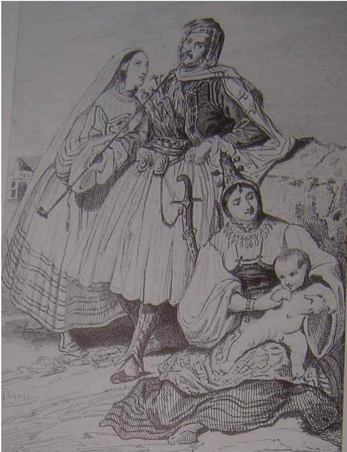
Litografia in cui è rappresentato un costume tradizionale maschile di abitante dell'Albania.