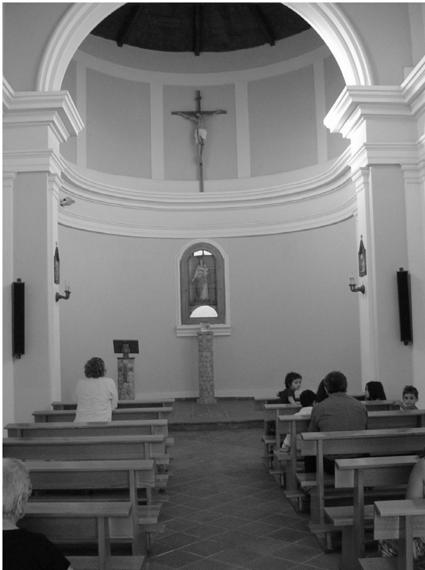
Interno cappella della Madonna di Bellacava