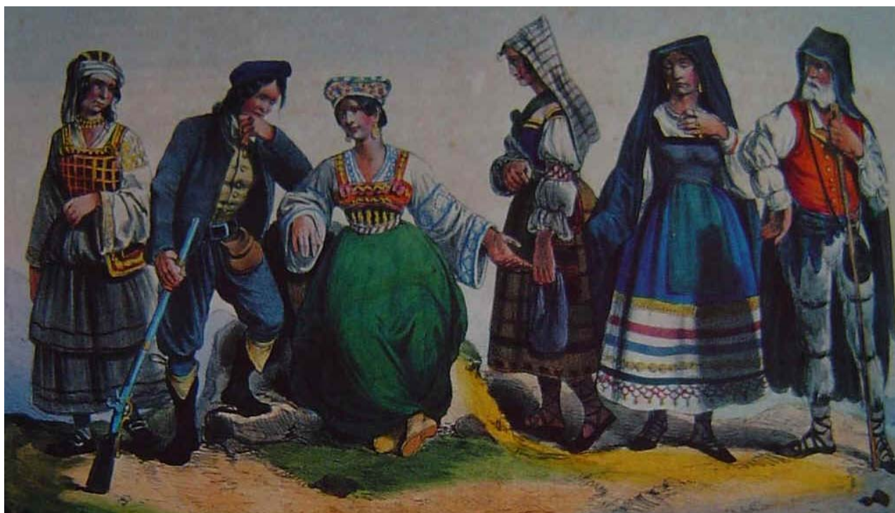
Tavola litografata colorata a mano risalente al 1840 per opera del Muller. La donna di Vena è solo la prima a sinistra, seguono costumi di altri paesi.