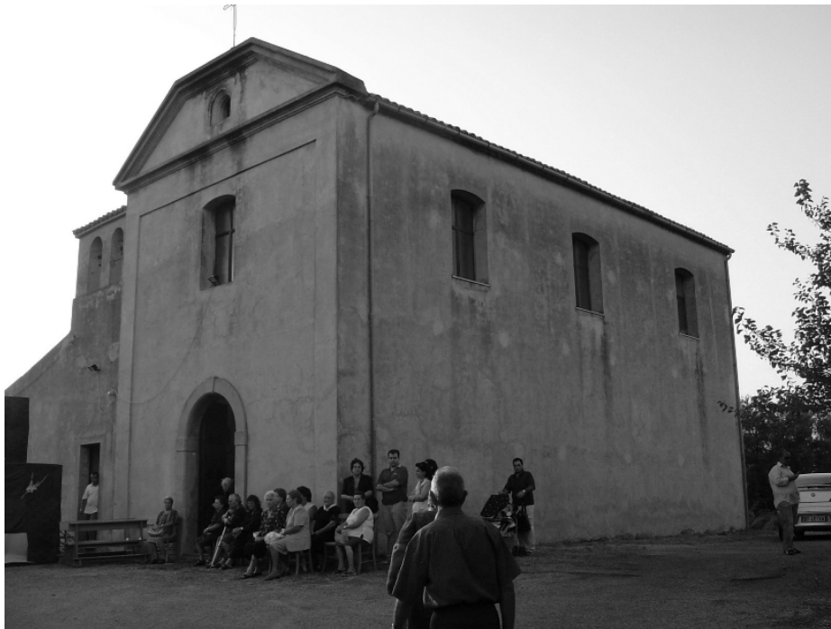
Chiesa della Madonna di Bellacava

Centro di ogni festività è la piazza del paese ottenuta demolendo negli anni sessanta un fabbricato padronale, di notevoli dimensioni, comunque ormai disabitato.