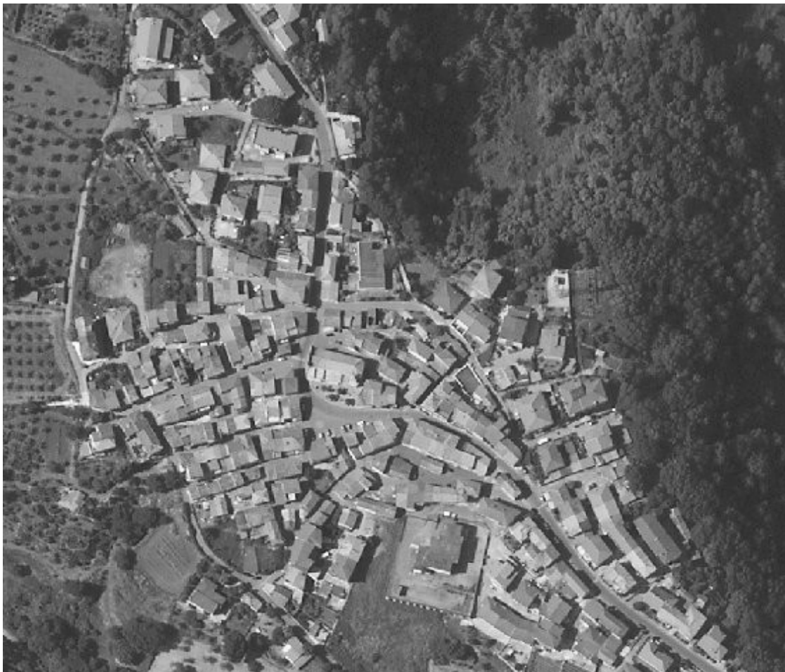
Vena (centro storico) vista dal satellite

In molti testi o dipinti viene indicata come Vinagreci , ma si ritiene che il nome sia sempre Vina con l'aggiunta greci per distinguerla da altri paesi calabresi con lo stesso nome. Si ricorda che l'appellativo di Greci veniva dato in passato a tutti coloro che venivano dalla sponda opposta dell'Adriatico.