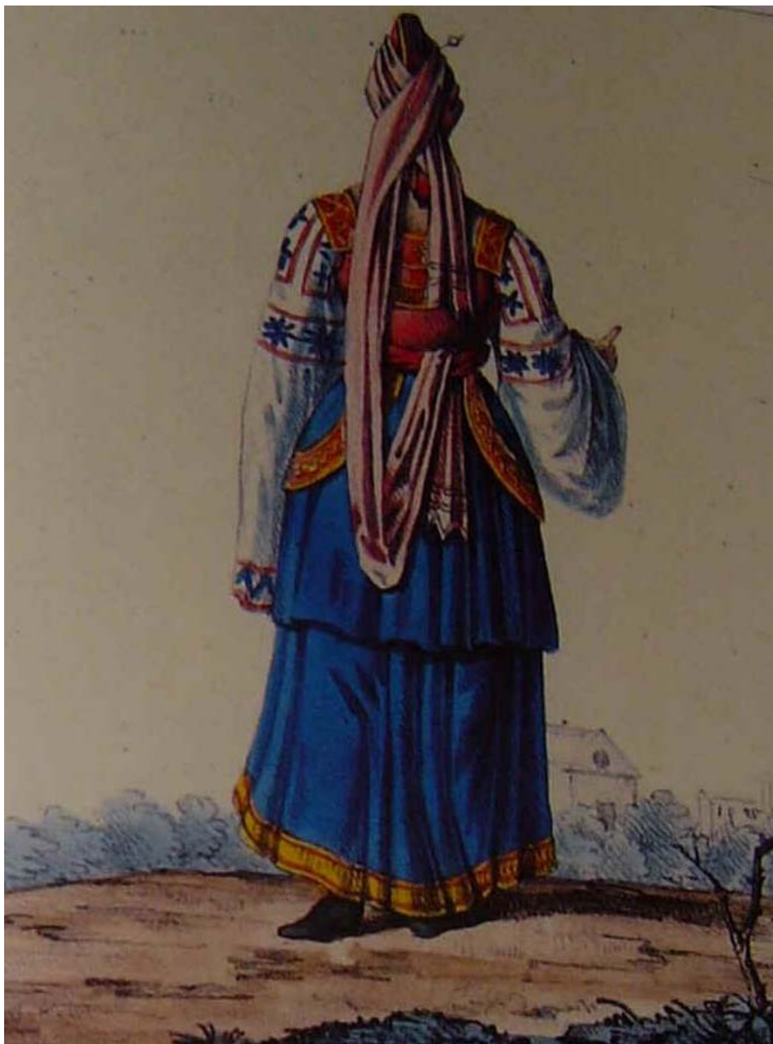
Stesso costume della figura precedente, ma visto di spalle.