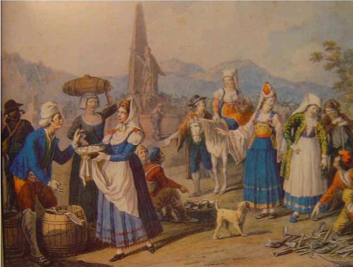
Fiera di S. Bruno. Si teneva a Serra S. Bruno durante la Pentecoste. Il costume di Vena è portato dalla donna a destra vicino al cavallo. - Acquerello Della gatta 1814.