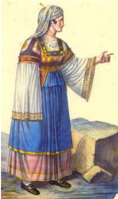
Costume di Vena Acquarello del 1600