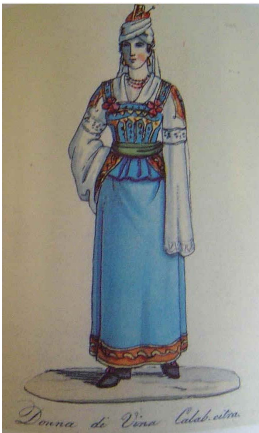
Figurina di cui non si conosce la provenienza