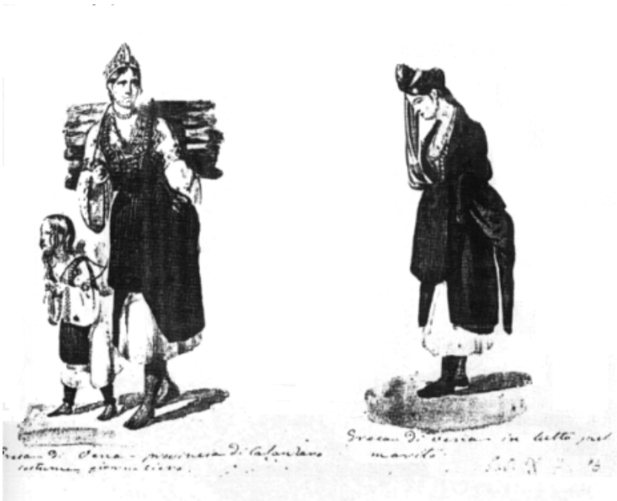
A sinistra: costume femminile giornaliero di Greca di Vena. A destra: costume di lutto. Sono conservati nell'archivio Disegni della Società Napoletana di storia Patria