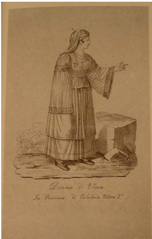
Costume di Vena. Stesso disegno, ma in bianco e nero.